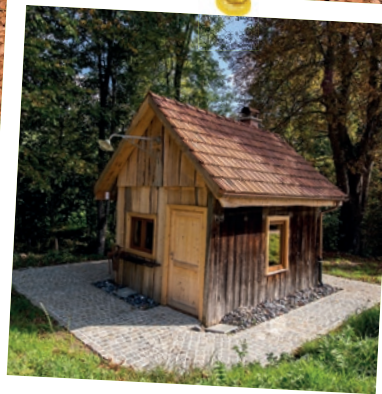
Esse zum spitzen Pickel